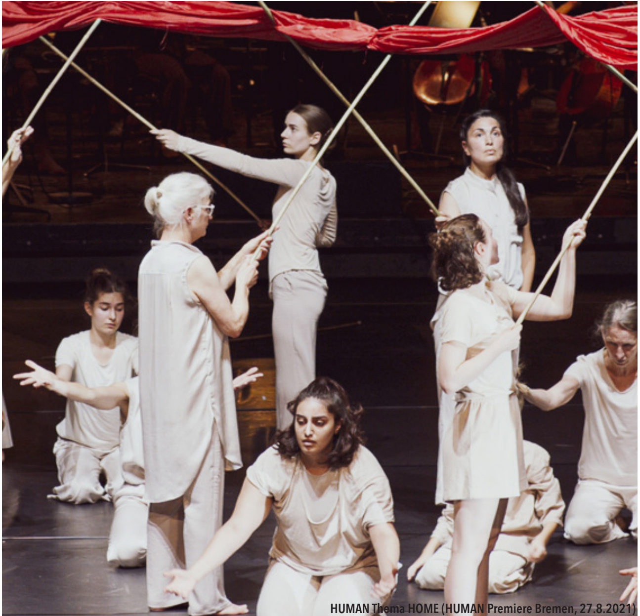
HUMAN Thema HOME (HUMAN Premiere Bremen, 27.8.2021)